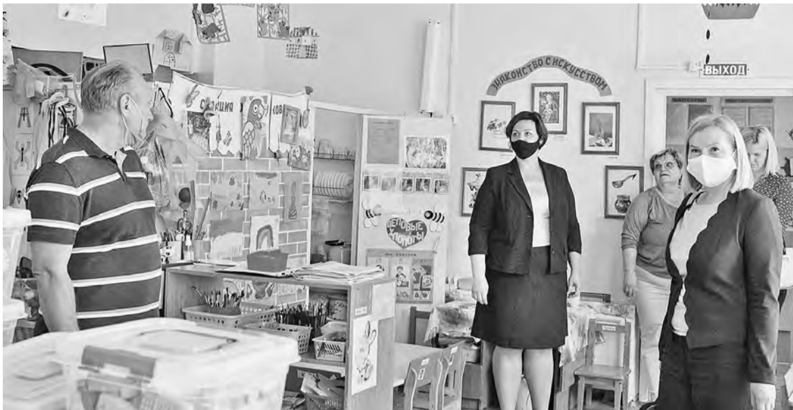
Приёмка готовности дошкольного отделения школы № 11