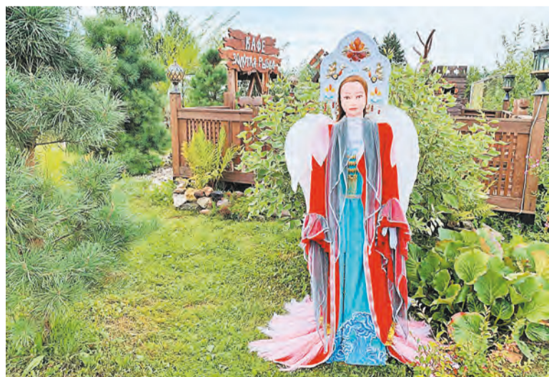
Прекрасная Царевна Лебедь