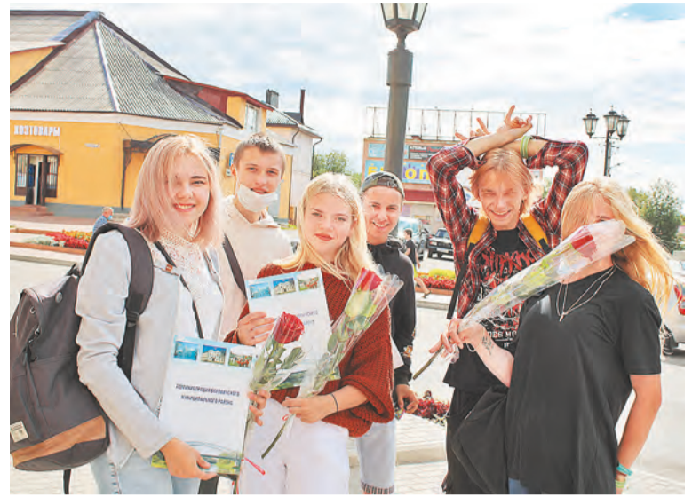
Быть добровольцем – не только благородно, но ещё и очень интересно