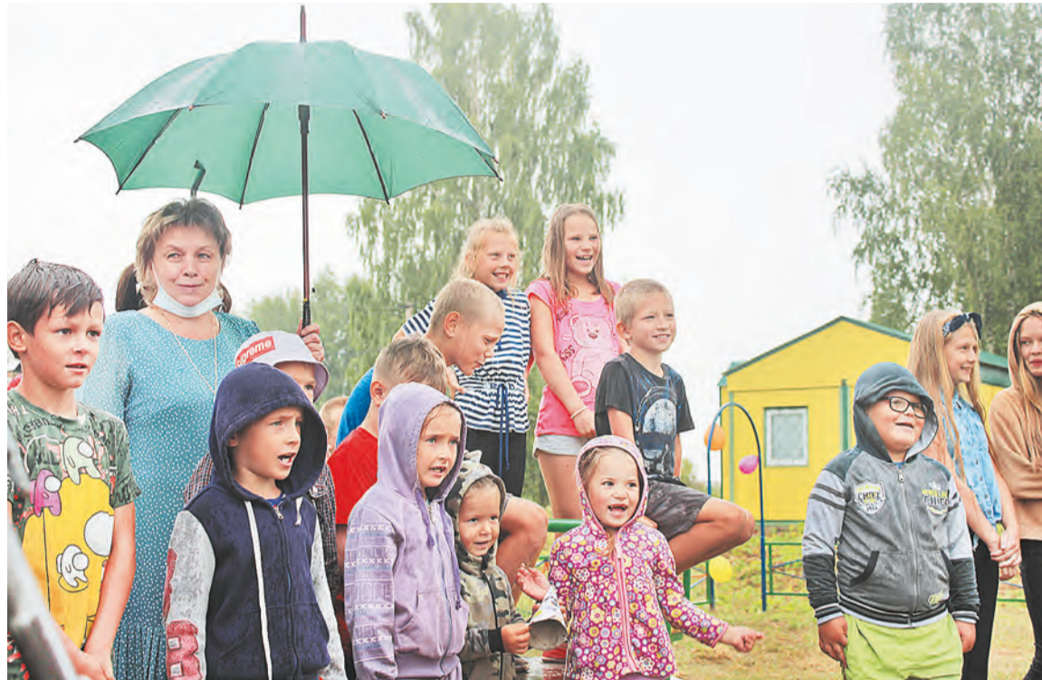
Дождливая погода – настроению не помеха!

Открытие обновлённой площадки проходит торжественно. Поздравить жителей усадьбы с праздником и поблагодарить членов