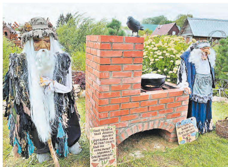
«Веселая» компания: Леший и Баба-Яга