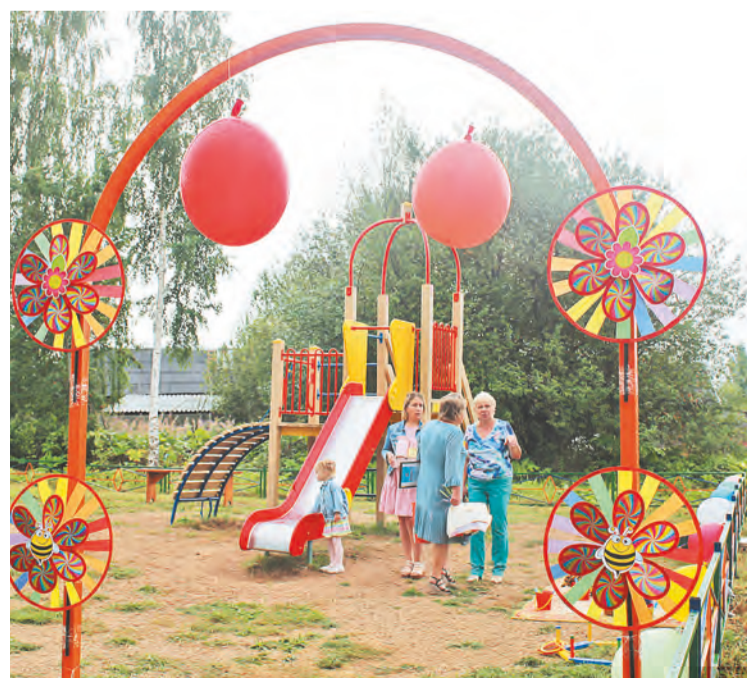
Праздничное настроение начинается со входа