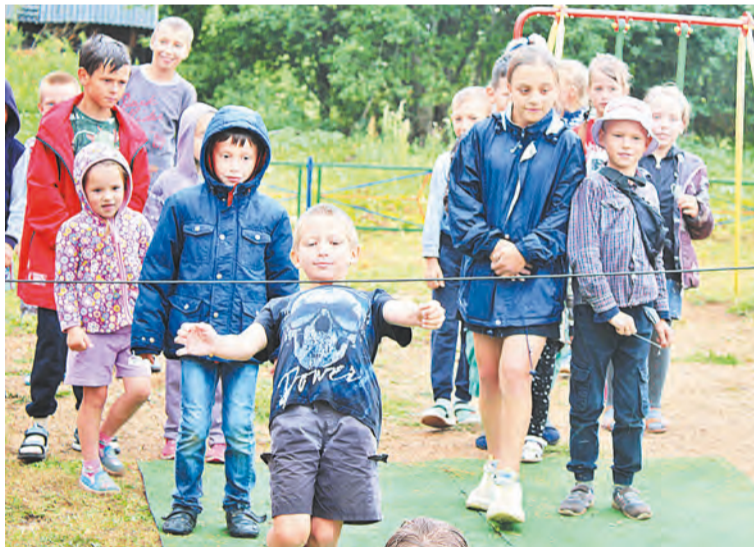
Команда верит – всё получится!

После официальной части детвору ждёт игровая программа и угощение. Дождь понемногу стихает. Возбуждённая «нестандартными» условиями праздника детвора с удовольствием участвует в конкурсах и эстафетах Ириски и клоуна Тяпы. Праздник удался.