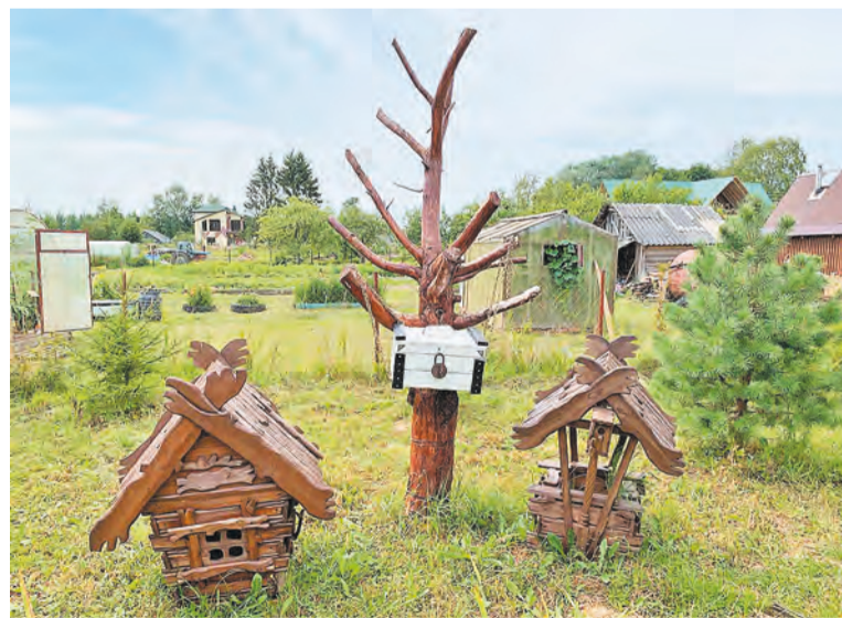
Совсем скоро на «дубе» появится «златая цепь», а рядом поселится «кот учёный»